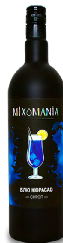
Сироп «Блю Кюрасао»