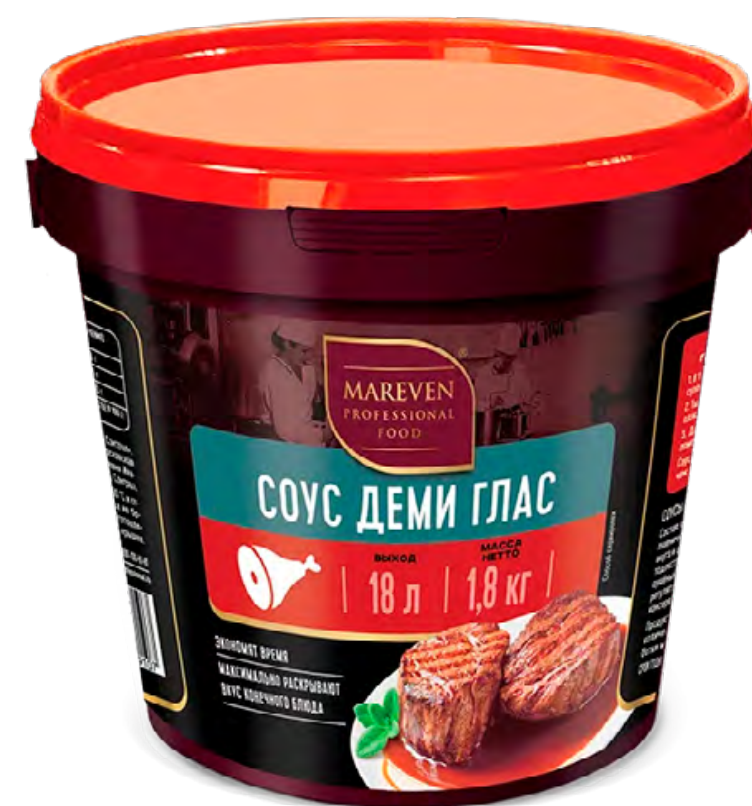
Соус Деми Глас